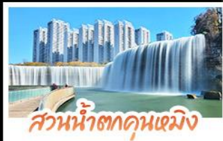
ส่วนน้ำตกคุณหมิง