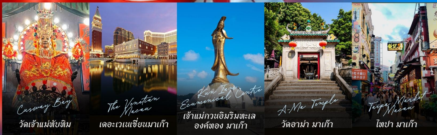
Casway Bay วัดเจ้าแม่ทับทิม

รายการทัวร์ข้างต้นอาจมีการปรับเปลี่ยนเพื่อความเหมาะสม