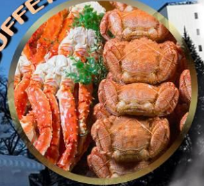
SAPPORO SNOW FESTIVAL 2027