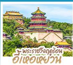
พระราชวังฤดูร้อน อี่เซวี่เฉียน

ทริปเดียวเที่ยว 2 เมือง ปักกิ่ง-ต้าเหลียน • เที่ยวจีนฟูลยูโรป ณ เมืองวนิสแห่งต้าเหลียน • สัมผัสประสบการณ์ขึ้นกำแพงเมืองจีน ด่านจวิยกกวน • ซ้อป ซิม ซิล ที่ถนนโบราณคกงวนและย่านชานหลี่กุน