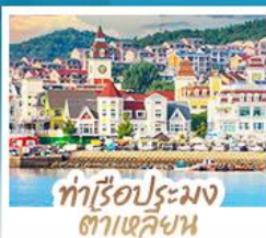
ท่าเรือประมง ต้าเหลียน