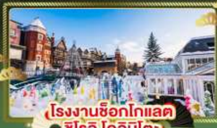
โรงงานช็อกโกแลต ชิโร โคอิจิโตะ