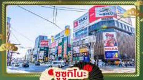
ซูซุกิโมะ