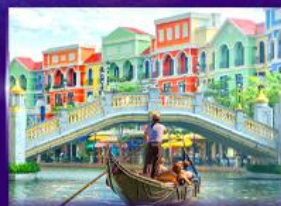
เวนิสจำลอง แกรนด์ เวิลด์