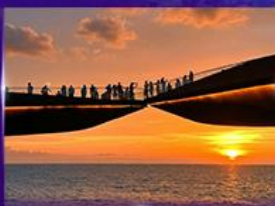
สะพานจูบ Sunset Town