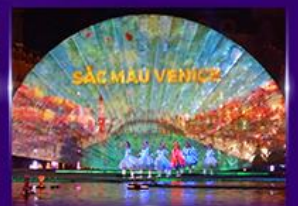
Sac Mau Venice Show