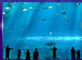
อควาเรียมยักษ์รูปเต่า