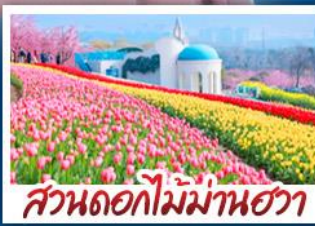
สวนดอกไม้ม้าฮวา