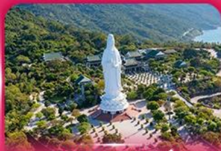
องค์กวนอิม วัดหลินอิ่ง