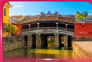
สะพานญี่ปุ่นโบราณ ฮอยอัน