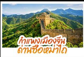
กำแพงเมืองจีน ด่านซือหม่าโต

ไฮไลท์ มรดกโลกสุดยิ่งใหญ่ ใจกลางกรุงปักกิ่ง พระราชวังต้องห้าม (กู้กง) สัมผัสประสบการณ์ขี่ม้ากำแพงเมืองจีน ด่านซือหม่าโต (รวมกระเช้าขึ้น-ลง) • ซ้อปิ้งกบนหวงฝูจิง และซานหลี่กุน