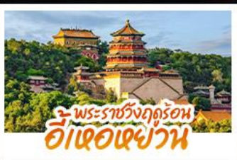
พระราชวังฤดูร้อน อี้เฮอเฉยวัน