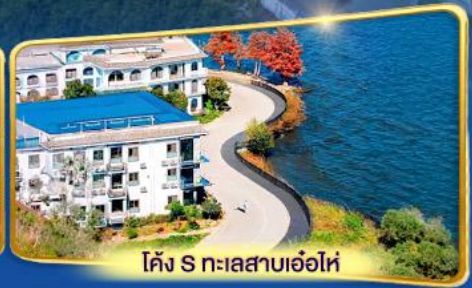
โค้ง S ทะเลสาบเอ่อไห่