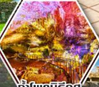
น้ำพุเบียร์ซูล