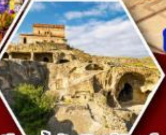
เมืองถ้ำอพิลิสต์ซิคห์