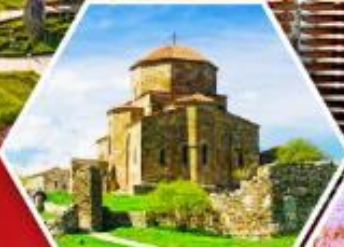
วิหารกอรี