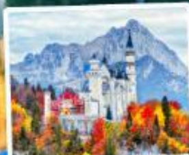
ปราสาทน้อยชวานส์ไตน์