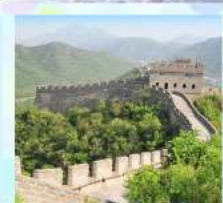
ตลาดร้อยปีเจิ้งหวิงเมี่ยว กำแพงเมืองจีน ด้านจวิ้ยกงวน