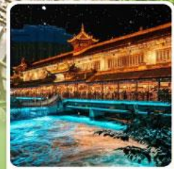
Blue Tears สะพานหนานเฉียว