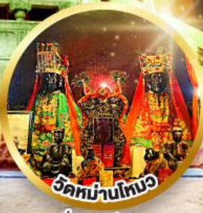
วัดท่าม่านใหม่

ขอพรเรื่องการศึกษา, การงาน สติปัญญาและความกล้าหาญ