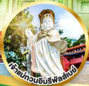
เจ้าแม่กวนอิมรพีลลัมย์