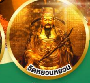
วัดหยวนหยวน

ขอพรเรื่องสุขภาพ, โชคลาภ ความเจริญก้าวหน้า