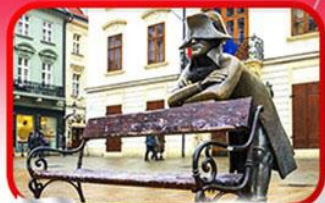
ย่านเมืองเก่า Bratislava

เที่ยวเมืองสวยริมทะเลสาบ ฮัลล์สตัดท์ • ชมเมืองไข่มุกแห่งโบฮีเมีย เซสกี กรุงลอน • ปราก • เวียนนา • ซอปปิงพาร์นดอร์ฟ เอาก์เล็ท