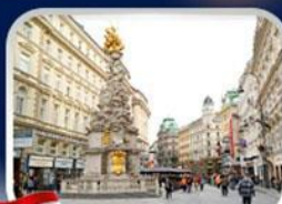
ช้อปปิ้งคาร์ทเนอร์สตรีก