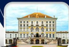
พระราชวังนิมเฟินบวร์ค