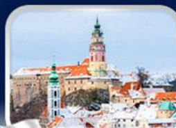
เมืองเช็กี่ คุลมอฟ