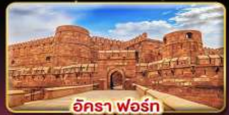
อัครา ฟอรั