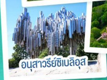
อนุสาวรีย์ซีเบลิอุส

ฟินแลนด์ - เอสโตเนีย - ลัตเวีย - ลิทัวเนีย แวะเที่ยวเซี่ยงไฮ้