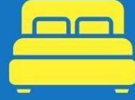
ห้องพักดับเบิล DOUBLE