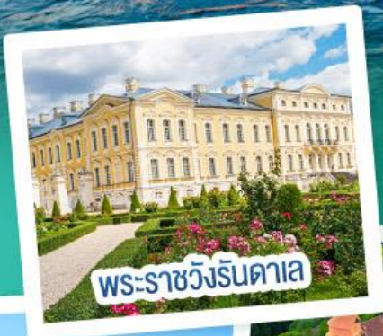
พระราชวังรินดาเล