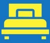
ห้องพักเดี่ยว SINGLE

ตัวอย่างประเภทห้องพัก *เป็นเพียงตัวอย่างเพื่อให้เห็นภาพสำหรับประเภทห้องในแบบต่างๆ