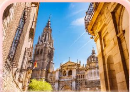
มหาวิหารแห่งโกเอลโด

ซาคราเดา ที่ว่ายิ่งใหญ่ ยังไม่เท่าใจ... ที่ให้เธอไปหมดแล้ว